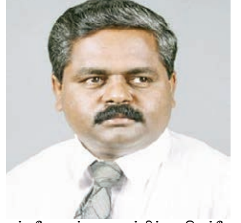
பும் போதும் புதுடில்லிக்கு சென்றே நோர்வே சென்றார்.

அமெரிக்கா மற்றும் மேற்குலக நாடுகளுடன் நாம் எவ்வளவு அன்னியோன்யமான தொடர்புகளை வைத்திருந்தாலும் இந்தியாவை புறந்தள்ளி அவர்களால் இங்கு எதுவும் செய்ய முடியாது. சமாதான காலத்தில் சமரச பேச்சுக்கான தூதுவராக இருந்த எரிக் சொல்ஹெய்ம் நோர்வேயிலிருந்து இலங்கை வந்த போது புதுடில்லிக்கு சென்றே வந்தார். இதே போன்று இலங்கையிலிருந்து திரும்