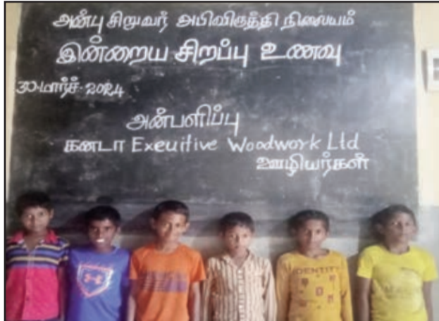
30 மார்ச் 2024 சனிக்கிழமை கனடா Exeutive woodwork Ltd ஊழியர்கள் அன்பு இல்லக் குழந்தைகளுக்கு சிறப்பு உணவு வழங்கி மகிழ்ந்தார்கள்.