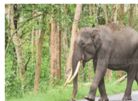
விளக்கை பயன்படுத்தி காட்டு யானையை விரட்டியுள்ளார்.

இதனையடுத்து சுற்றுலா வழிகாட்டி தனது மோட்டார் சைக்கிளின் ஓலியை எழுப்பி பிரதான மின்