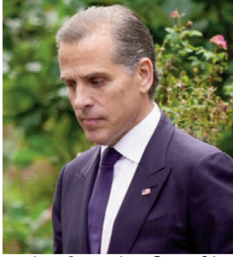
களும் போதைப் பொருளிற்கு அடிமையான வேளை துப்பாக்கிகளை வைத்திருந்த ஒரு குற்றச் சாட்டும் சுமத்தப்பட்டமை குறிப்பிடத்தக்கது. 2018ம் ஆண்டு கைத் துப்பாக்கியை கொள்வனவு செய்த

துப்பாக்கியை கொள்வனவு செய்த வேளை தான் போதைப்பொருள் பாவனையாளர் இல்லை என ஹண்டர் பொய் சொன்னமை தொடர்பில் இரண்டு குற்றச்சாட்டு