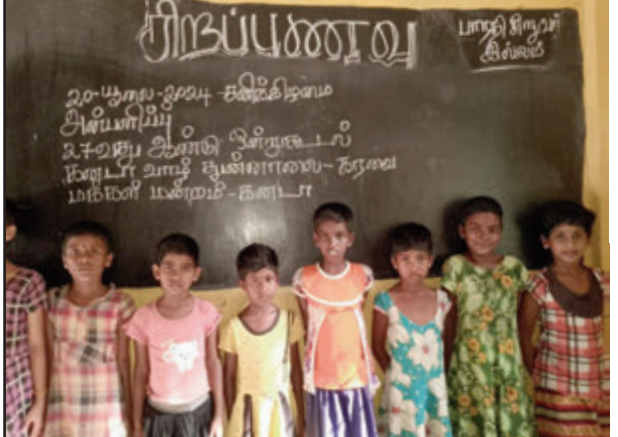
20 யூலை 2024 சனிக்கிழமை கனடாவும் தன்னாலை கரவை மக்கள் மன்றத்தின் 27வது ஆண்டு ஒன்றுகூடல் நிகழ்வு அன்பளிப்பாக பாரதி இல்லக் குழந்தைகளுக்கு சிறப்பு உணவும் இனிப்பு வகைகளும் வழங்கி மகிழ்ந்தார்கள்