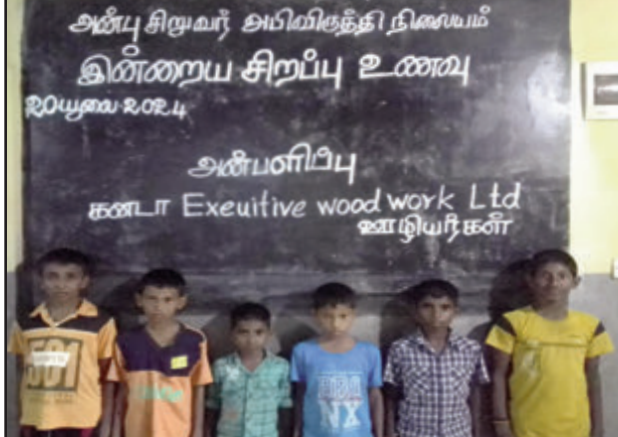
20 யூலை 2024 சனிக்கிழமை கனடா Exeutive woodwork Ltd ஊழியர்கள் அன்பு இல்லக் குழந்தைகளுக்கு சிறப்பு உணவு வழங்கி மகிழ்ந்தார்கள்.