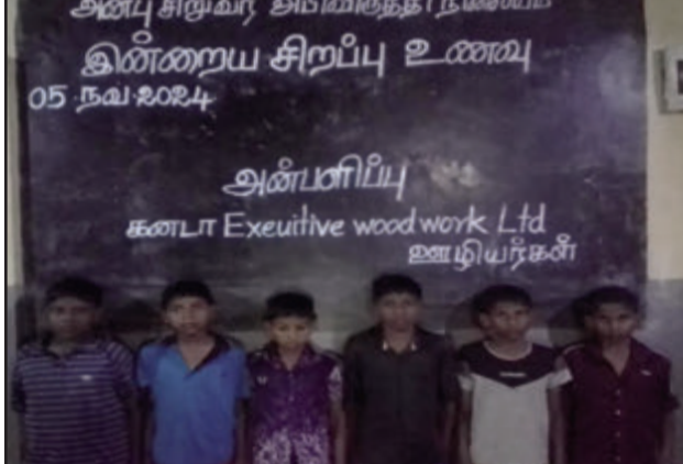
05 நவம்பர் 2024 செவ்வாய்க்கிழமை கனடா Exeutive woodwork Ltd ஊழியர்கள் அன்பு இல்லக் குழந்தைகளுக்கு சிறப்பு உணவு வழங்கி மகிழ்ந்தார்கள்.