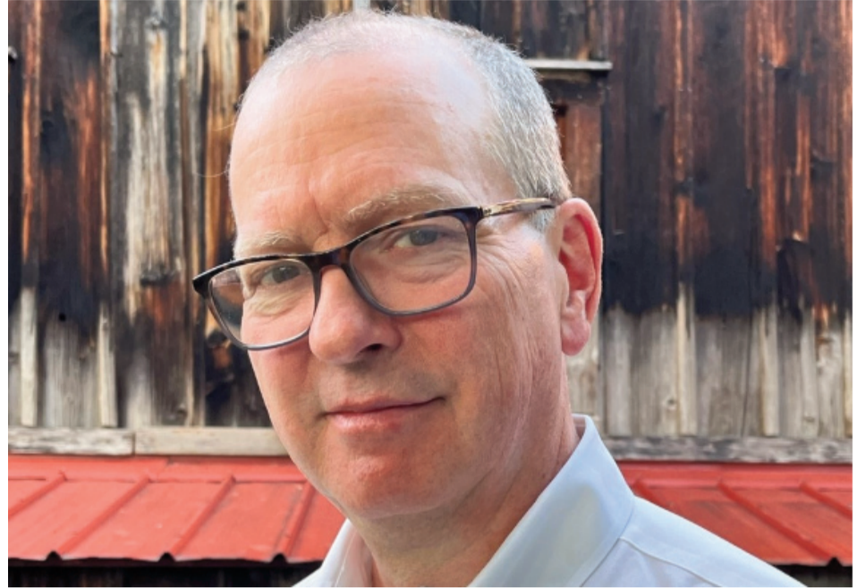
திசாநாயக்கவின் தோற்றம் ஒரு மார்க்சிஸ்டாக இருக்கலாம்.

அத்துடன் இலங்கை பல தசாப்தங்களாக இன பதற்றம், பிளவுபடுத்தும் அரசியல் மற்றும் மிருகத்தனமான மோதல்களை சர்வதேச நிகழ்ச்சி நிரல்களுக்குள் கொண்டுள்