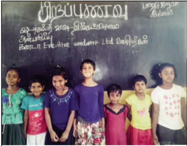
23 டிசம்பர் 2024 திங்கட்கிழமை கனடா Exeutive woodwork Ltd ஊழியர்கள் பாரதி இல்லக் குழந்தைகளுக்கு சிறப்பு உணவு வழங்கி மகிழ்ந்தார்கள்.