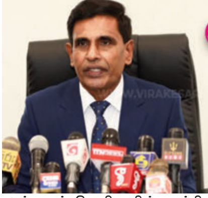
அல்லாமல் பொலிஸாரின் சுதந்திரமான செயற்பாட்டை நாம் உறுதிப்படுத்தியுள்ளோம்.

சட்டத்தின் அடிப்படையில் செயற்படுவதற்குப் பொலிஸாருக்கு முழுமையான சுதந்திரம் உண்டு. சட்டத்தின் அடிப்படையில் செயற்படும் போது பொலி