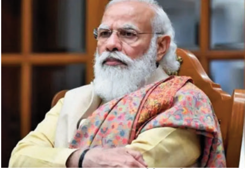
அமைந்தது. கலாநிதி எஸ் ஜெய்சங்கர் ஆவார்.

அநுரகுமாரவின் இந்தியப் பயணம், பதவியேற்ற பின்னர் அவரது முதல் சர்வதேச விஜயமாக