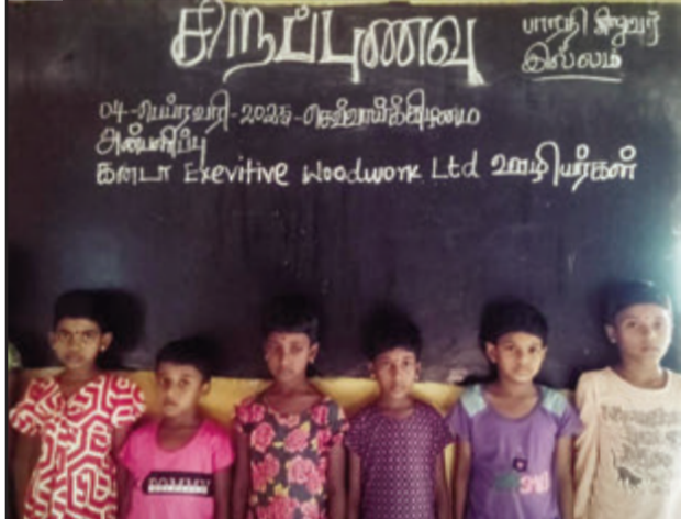
04 பெப்ரவரி 2025 செவ்வாய்க்கிழமை கனடா Exevitive woodwork Ltd ஊழியர்கள் பாரதி இல்லக் குழந்தைகளுக்குச் சிறப்பு உணவு வழங்கி மகிழ்ந்தார்கள்.