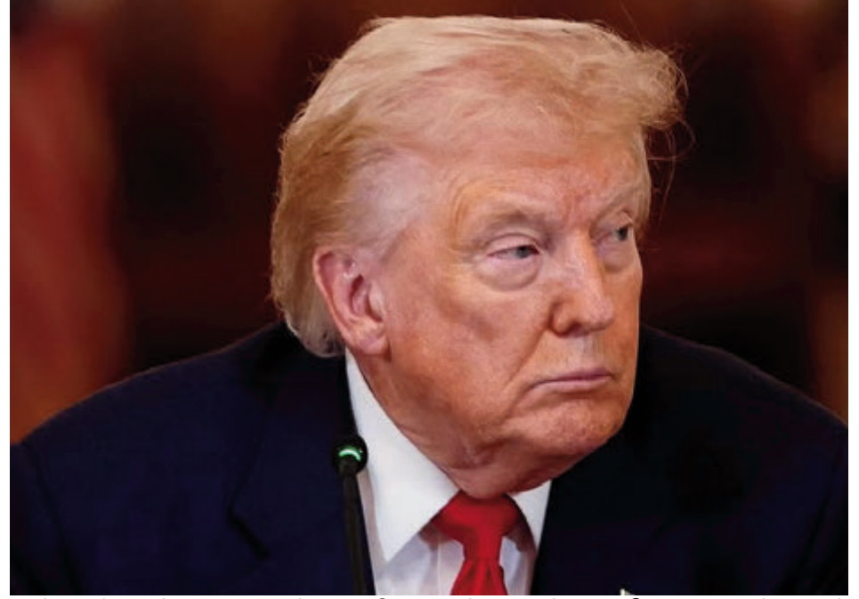
தாக்குதல்களுக்கு முன்னதாகவே, இஸ்ரேல் திட்டமிட்டுள்ள தாக்குதல்

கள் மூலம் ஈரானிய தலைவர்களைக் கொல்ல முயல்வது, வளைகுடா நாடுகளில் உள்ள அமெரிக்க ராணுவ மற்றும் தூதரகத் தளங்கள் மீது ஈரான் பதிலடி கொடுப்பதற்கு வழிவகுக்கக்கூடும் என்று அமெரிக்க உளவுத்துறை கணித்திருந்தது எனத் தகவல் தெரிவிக்கப்பட்டுள்ளது.