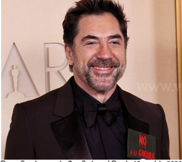
ஹொலிவுட் நடிகர் ஜேவியர் பார்டெம் 15 மார்ச் 2026 ஞாயிற்றுக்கிழமை நடைபெற்ற ஒஸ்கார் விருது விழாவில் பாலஸ்தீனத்திற்கு ஆதரவாகவும் போருக்கு

எதிராகவும் குரல் கொடுத்த செய்தி சர்வதேச ரீதியில் வைரலாகி வருகின்றது. செய்தி தொகுப்பு