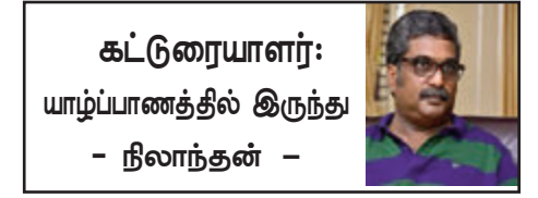
கட்டுரையாளர்: யாழ்ப்பாணத்தில் இருந்து - நீலாந்தன் -

மத்தியிலும் உண்டு. இலக்கியவாதிகள் தங்களுக்கு இடையே மோதும் போது எதிர்த் தரப்பின் இடுப்புக்கு கீழே அடிப்பது என்பது நீண்ட காலமாக இருந்து வருகிறது. யாருக்கு எங்கே அடித்தால் அதிகம் வலிக்குமோ அந்த உயிர் நிலையில் அடிப்பது. அதாவது பிறப்பு உறுப்பில் அடிப்பது. அல்லது