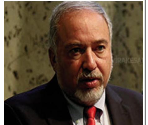
விமானப் பயணத்தையும் ஏற்கனவே கடுமையாகப் பாதித்துள்ளன.

இஸ்ரேல் மற்றும் அமெரிக்கத் தளங்கள் அமைந்துள்ள ஜோர்டான், ஈராக் போன்ற நாடுகள் மீது ஈரான் நடத்திய ஆளில்லா விமானத் தாக்குதல்கள், உலகளாவிய சந்தைகளையும்