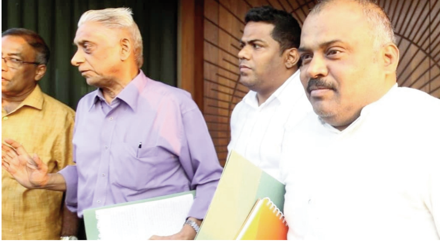
கட்டுரையாளர்: யாழ்ப்பாணத்தில் இருந்து - நீலாந்தன் -

அரசாங்கம் ஒரு புதிய யாப்பைக் கொண்டு வருமா என்பது சந்தேகத்தான். சில சமயம் அரசாங்கம் அந்த