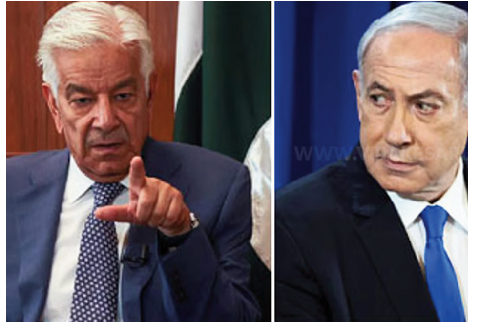
தற்காத்துக் கொள்ளும் என்றும் கிடயான் ஸார் கூறியுள்ளார்.

இரு நாடுகளுக்கிடையேயான அமைதிக்கான பேச்சுவார்த்தைக்கு மத்தியஸ்தம் வகிப்பதாகக் கூறிக்கொண்டிருக்கும் ஒரு அரசாங்கத்திடமிருந்து வரும் இந்த அப்பட்டமான யூத விரோத இரத்த அவதூறு வார்த்தைகளை இஸ்ரேல் வெளியுறவுத்துறை அமைச்சர் கடுமையாக சாடுகிறார். இஸ்ரேலை அழிப்பதாக சபதம் செய்யும் பயங்கரவாதிகளிடமிருந்து இஸ்ரேல் தன்னை