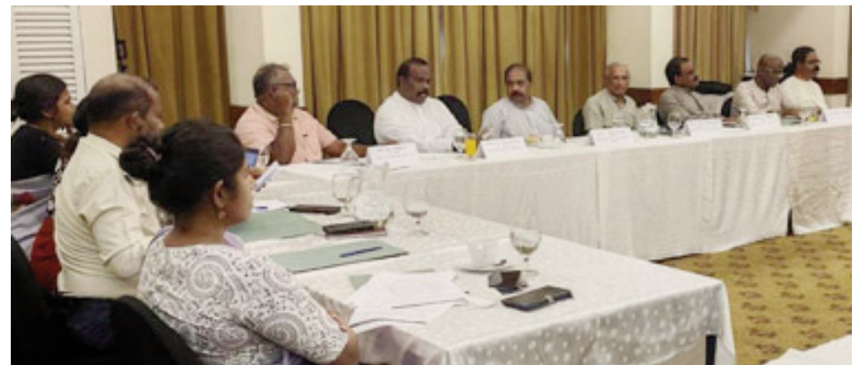
கும், தமிழரசுக் கட்சிக்கும் இடையிலான சந்திப்பு நடைபெற்றிருந்தது.