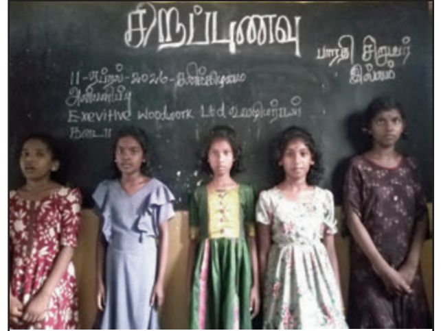
11 ஏப்ரல் 2026 சனிக்கிழமை கனடா Exeutive woodwork Ltd ஊழியர்கள் பாரதி இல்லக் குழந்தைகளுக்குச் சிறப்பு உணவு வழங்கி மகிழ்ந்தார்கள்.